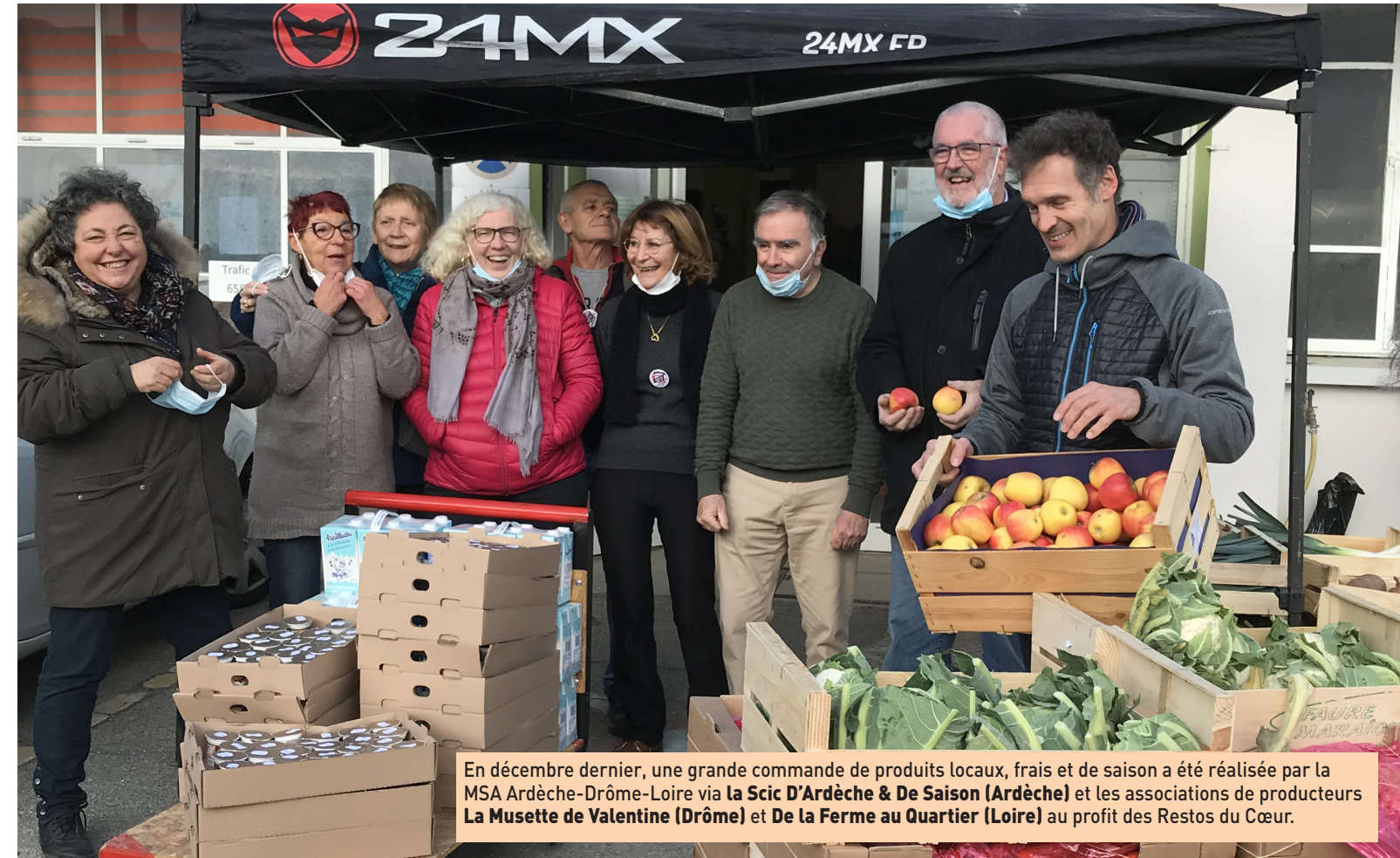
En décembre dernier, une grande commande de produits locaux, frais et de saison a été réalisée par la MSA Ardèche-Drôme-Loire via la Scic D'Ardèche & De Saison (Ardèche) et les associations de producteurs La Musette de Valentine (Drôme) et De la Ferme au Quartier (Loire) au profit des Restos du Cœur.

ALÉAS CLIMATIQUES / Les élus de la MSA Ardèche-Drôme-Loire sont présents sur le terrain pour accompagner les agriculteurs et faire remonter leurs besoins aux services compétents de la caisse. Des « sentinelles » indispensables à la suite d'aléas climatiques, notamment le gel en 2021.